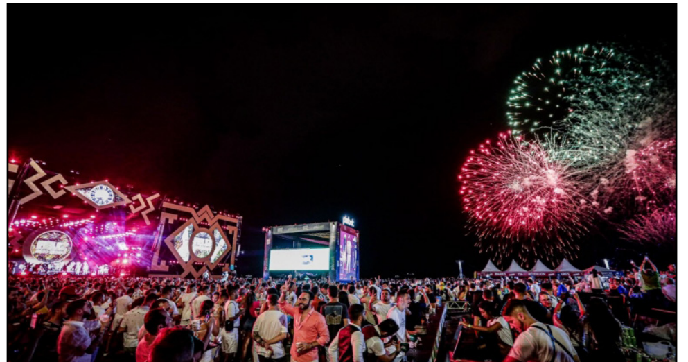
A Prefeitura do Recife, com um formato inédito de parceria com a iniciativa privada, realizou o maior réveillon da história da cidade ao som de muito frevo, samba, brega, piseiro e sertanejo na programação

Para a realização de um evento de tal magnitude, a Prefeitura do Recife contou com o trabalho do SAMU, CTTU, Emlurb, Assistência Social, Controle Urbano, Guarda Municipal, Secretaria de Turismo e Lazer, Secretaria de Saúde, Secretaria de Governo e Participação Social, Assistência Militar do Recife e Defesa Civil do Recife.