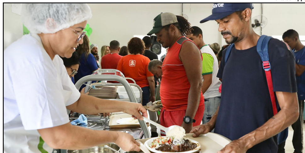
Além dos restaurantes populares e das unidades de alimentação e nutrição das casas de acolhimento, a rede de segurança alimentar e nutricional do Recife também conta com a Cozinha Comunitária do Gurupé, requalificada há um ano, e com o Banco de Alimentos, inaugurado em abril