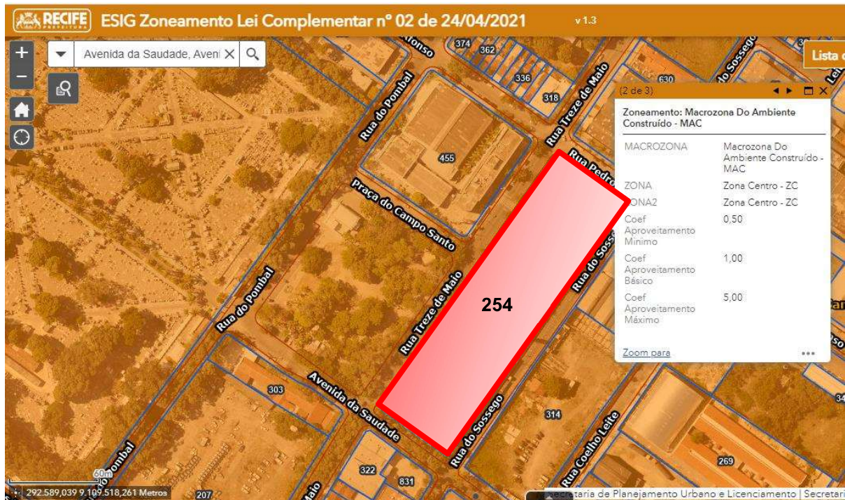
Figura 1: Localização do imóvel na Zona Centro do Plano Diretor do Município de Recife.